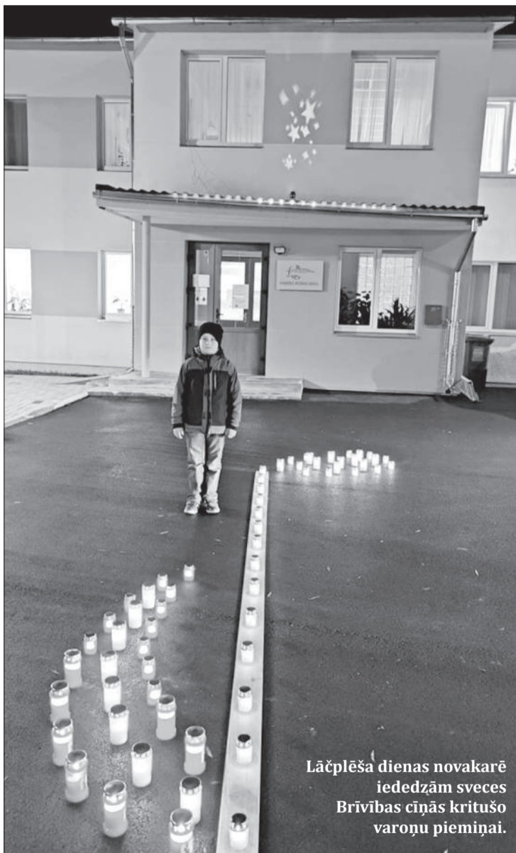
Lāčplēša dienas novakarē iedezzām sveces Brīvības cīņās kritušo varoņu piemiņai.